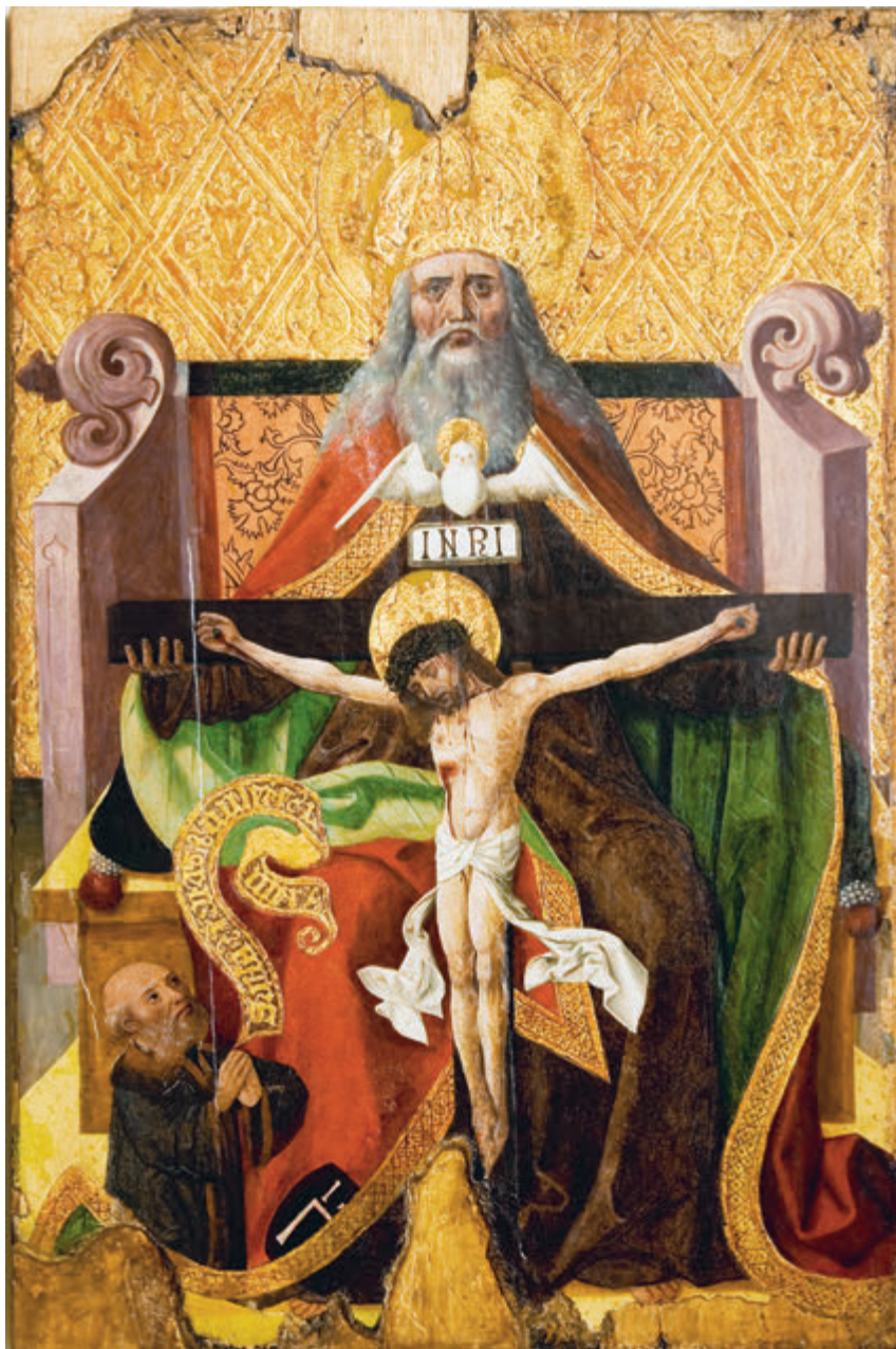
498. Худ. невід. Свята Трійця. XVI ст. Д., о. 118, 7х78,5. Пост. 1940 р. з Музею Яна III Собеського у Львові, раніше — у Вірменському соборі Львова. ЛГМ. Ж-1649*