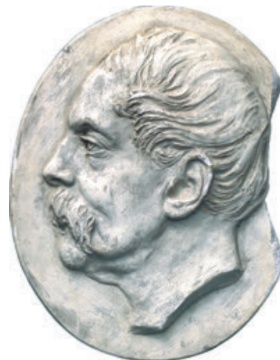
71. Баронч Т. Каєтан Баронч. 1894. Медальйон, гіпс. Овал 38,5x31,5. На звороті напис: «Kajetan Baranč». Пост. 1940 р. зі збірки Львівської міської галереї. ЛГМ. С-II-664