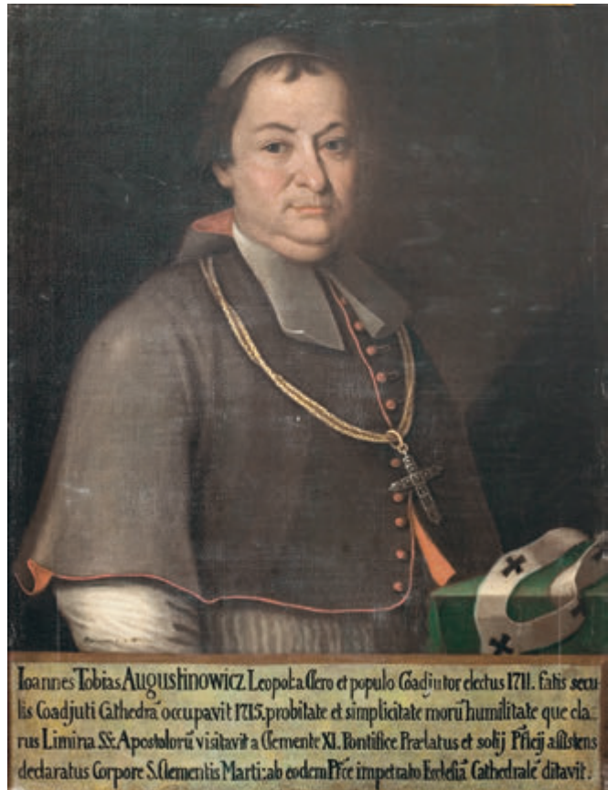
75. Білявський О. Портрет Яна Тобиаша Августиновича. 1801. П., о. 85x65. Пост. 1972 р. з ЛІМ, до 1940 р. — у збірці Вірменського архидієцезіального музею у Львові. ЛГМ. Ж-4518*