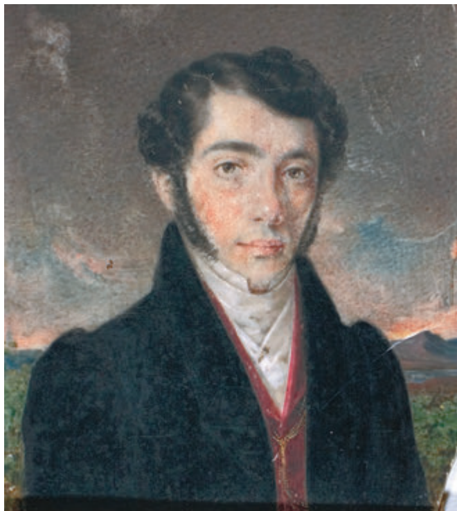
70. Рейхан А. Портрет-мініатюра Каєтана Баронча. Пензлик, фарба для мініатюри. 9x8. Пост. 1954 р. з ЛІМ. ЛГМ. Г-III-244