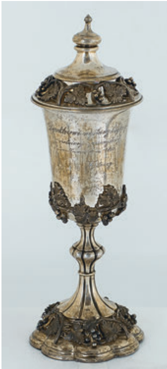
74. Кубок Промислової виставки у Львові. 1877. Срібло: кубок 860°; кришка 800°, 10x8. На кубку герб і напис: «Dyrektorowi wystawy krajowej rolniczej i przemysłowej we Lwowie 1877 wystawcy. Boleslawowi Augustynowiczewi z Książęgo». ЛІМ. Мт-2484*