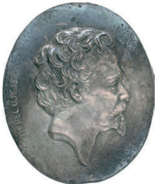
72. Баронч Т. Корнелі Уейський. 1872. Медальйон, гальванопластика. Овал. 25,7x21,8. Пост. 1940 р. зі збірки Львівської міської галереї. ЛГМ. С-II-466